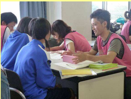
9/17@七ヶ浜中央公民館 学習支援

第15タームの9月17日、18日は学習支援ボランティアを行いました。七ヶ浜周辺の仮設住宅や一般住宅にお住まいの方へ案内を行い、土日ともに約25名の小・中・高校生が来てくれました！