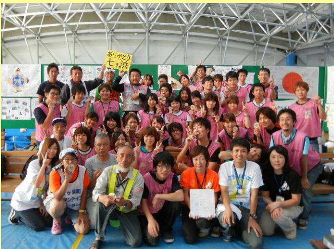
「必ず、また来ることを誓う」VC運営スタッフ、現場リーダーの方との集合写真