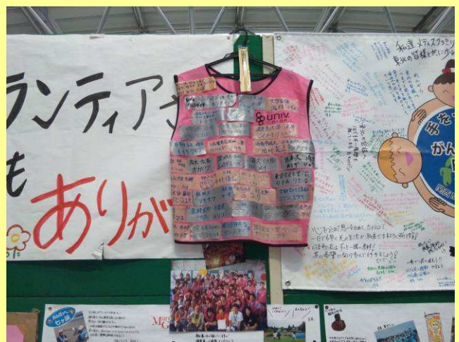
VCに飾られたビブスと集合写真