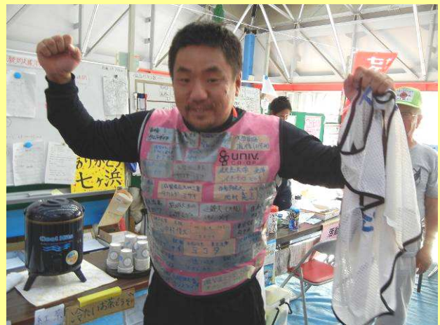
9/18みんなの名札を貼ったビブスをVCへ

大学生協連として、ニーズの調査を継続し、今後のボランティアを検討をしていきます。