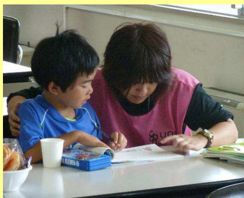
← 小学生への個別指導の様子

後日、学習支援に参加した高校生の保護者の方から「学習支援に参加して数学のテストの点数が上がった。本当にありがとうございました。今後も何らかの形で学習支援に来てほしい」という感謝の言葉を頂くことができました。