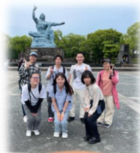
わたしたちが PN!N2024 実行委員会です！