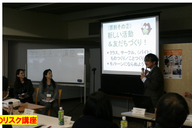
20年2月のリスク講座