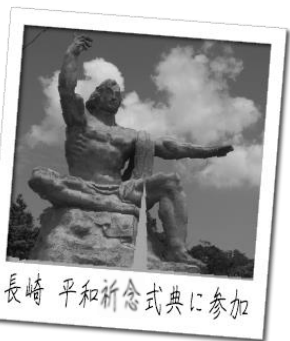
長崎 平和祈念式典に参加