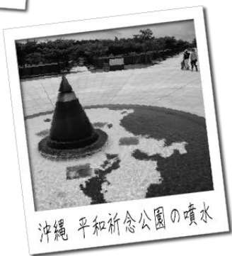
沖縄 平和祈念公園の噴水