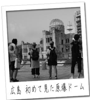
広島 初めて見た原爆ドーム