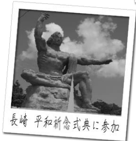
長崎 平和祈念式典に参加