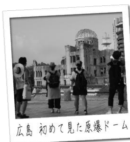
広島 初めて見た原爆ドーム