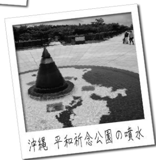
沖縄 平和祈念公園の噴水