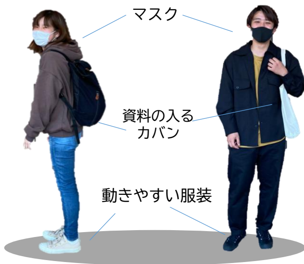
写真協力：PN!N実行委員（左から松田、進藤）