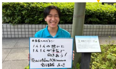
PeaceNow! Okinawa 実行委員長 よつき

『もしも私があなたの立場だったら/あなたが私の立場だったらどう考えるだろう』を想い、一人一人の意見に互いに本気で向き合うことが当たり前になる社会をわたしたちで創っていきたい。