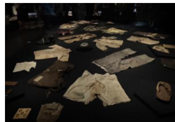
広島平和記念資料館へ見学

被爆した下級生の救護や火葬をしたというお話が非常に印象的だった。原爆は、人々の命や生活を奪っただけでなく、人間の尊厳をも奪うものであったのだと感じた。 (信州大1年)