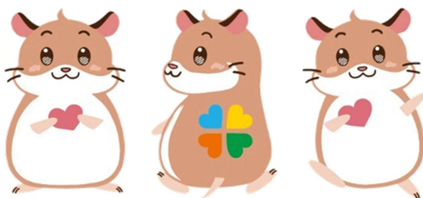
大学生協奨学財団キャラクター ヘルム