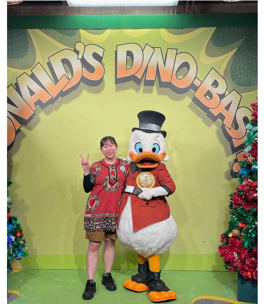
3. Animal Kingdomで Merchiandiseの 仕事を体験 (Africaエリア)