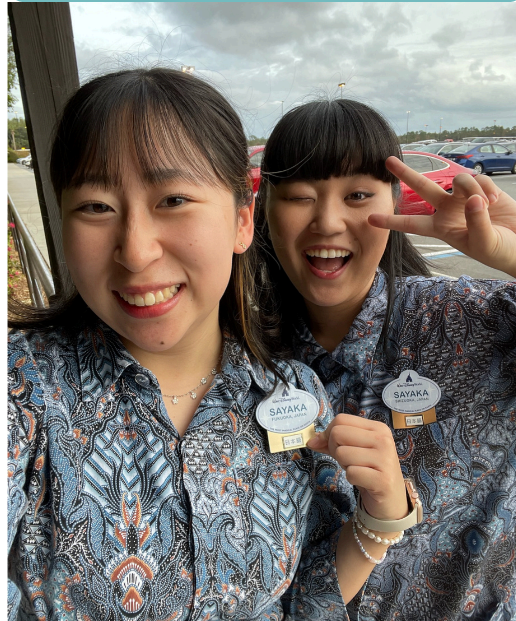
2. Animal Kingdomで Merchiandiseの 仕事を体験 (Asiaエリア)