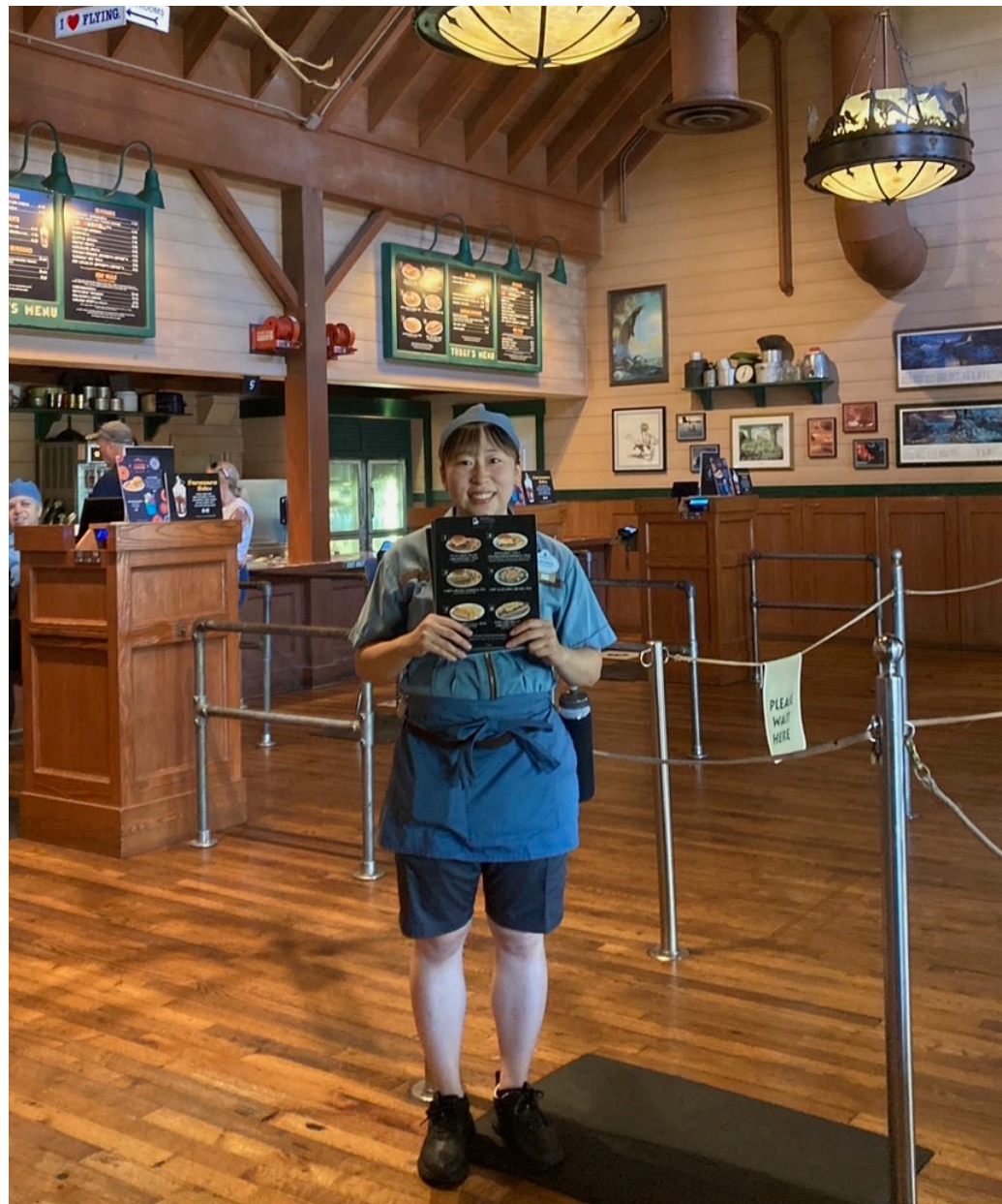
1. Animal Kingdom でQuick serviceの 仕事を体験